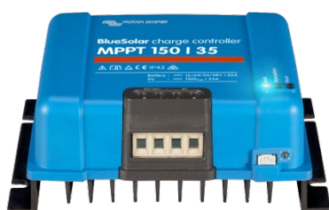
Contrôleur de charge solaire MPPT 150/35